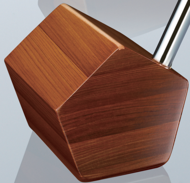
ヘッド:リグノテクス集成構造(檜)